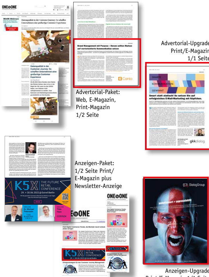
Advertorial-Upgrade Print/E-Magazin 1/1 Seite